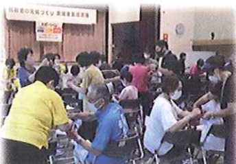
高齢者の元気づくり支援者養成講座

昨年度は、コロナ以前の賑わいやコミュニケーション活動が戻ってきた感のある充実した内容となりました。