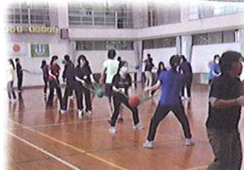
教職員向けレクリエーション研修会