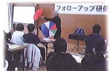
フォローアップ研修会